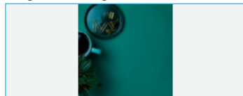
Imagem do Background