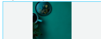
Imagem do Background