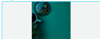
Imagem do Background