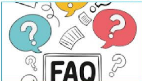
Imagem de fundo da página - Perguntas Frequentes (1600x900)