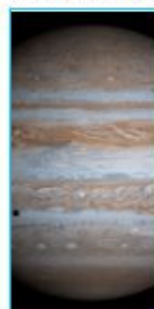
Ícone to último teste (300x600)