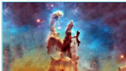
"Meu progresso" imagem de fundo da página (1600x900)