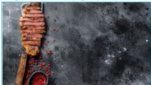
Imagem de fundo da página principal (1600x900)