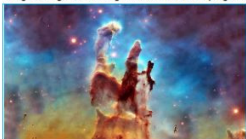
Ícone da pesquisa final (300x600)