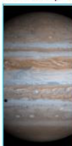
Ícone to último teste (300x600)