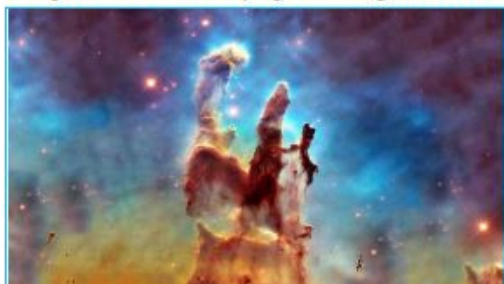
"Meu progresso" imagem de fundo da página (1600x900)